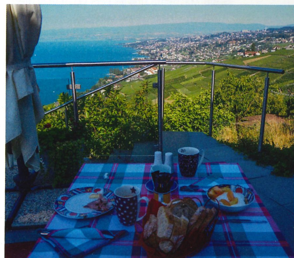
Villa Lavaux, Bed & Breakfast & tolles Panorama.