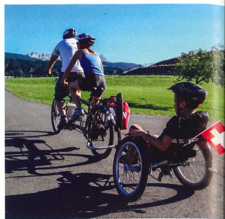
Links: Blick von Chexbres. Oben: Vor Appenzell mit Alpstein-Panorama.

Die insgesamt 12.000 Höhenmeter wirken auf den ersten Blick zwar abschreckend, doch Herzroute-Erfinder Hasler wiegelt poetisch ab: „Mit einem elektrischen ‚Schrittmacher‘ wird die Herzroute auch für Hügelmuttel zum Genuss. Sogar im Emmental und Toggenburg, wo besonders renitente Höhenlinien ihr Unwesen treiben, lupft einen das E-Bike sanft auf die nächste Geländekante.“