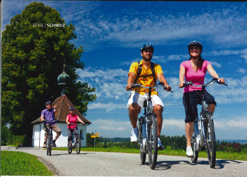
Ganz entspannt im Kanton Luzern.