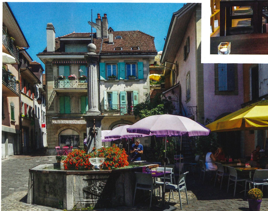
Lutry mit zahlreichen Bürger- und Patrizierhäusern aus dem 15. bis 18. Jahrhundert.