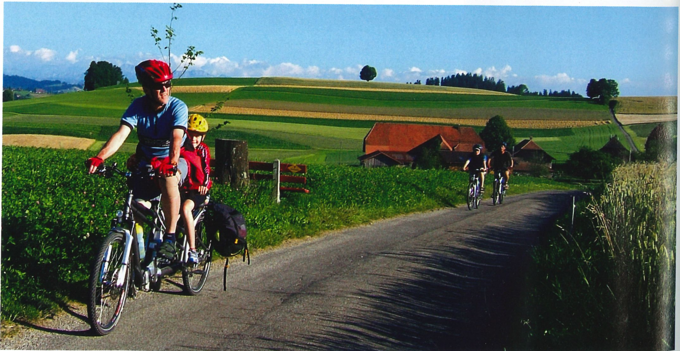
Charakteristische Hügellandschaft im Emmental.

Zwischen 2010 und 2012 folgte via Langnau, Thun und Romont die Erweiterung um fünf westliche Etappen bis zum Genfersee nach Lausanne und um ein östliches Teilstück bis Zug. 2014 stand eine größere