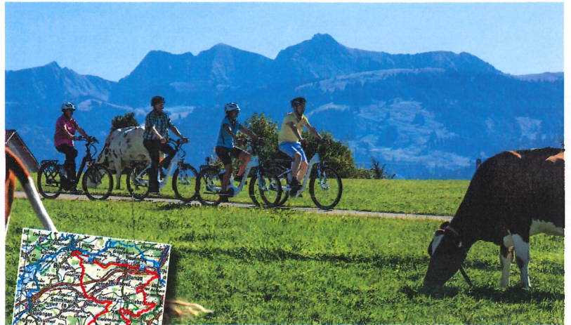
Am südlichsten Punkt der längsvalen Route eröffnet sich ein gewaltiges Voralpenpanorama. Links die Übersicht der Herzroute-Zusatzschleife Sense, ausgehend von Laupen.

Das Dorf Rechthalten, angelehnt an den Fofenhübel, lädt zum Zwischenhalt mit Verpflegung ein. Wenige Kilometer weiter, am Übergang von der Gras- zur Forstkultur, kratzt man kurz an der 1000-Meter-Marke. Hier