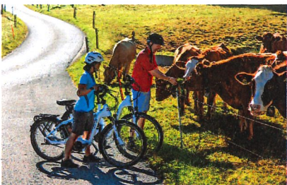
Bild links: Auf dem Sensebypass sind Begegnungen mit zwei- und vierbeinigen Einheimischen garantiert. Bild Mitte: Verträumte Kapellen am Wegesrand weisen auf eine in der Region verankerte Sakralkultur hin.