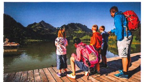
BILDER HERZROUTE AG