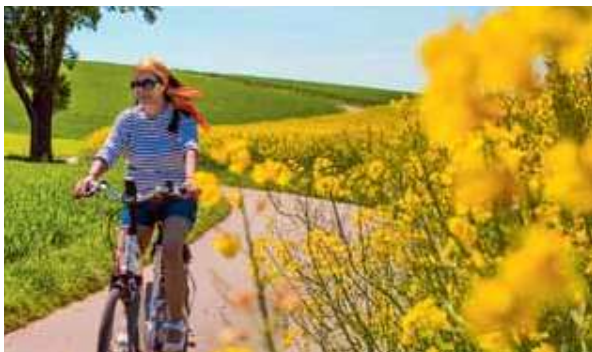
Unterwegs Richtung Süden: Mit der Unterstützung des Flyers sind die 60 Kilometer (fast) ganz ohne Anstrengung machbar.